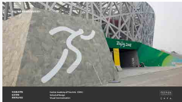
中央美术学院参与设计 (部分案例)