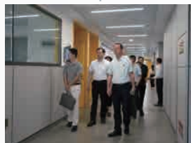
2023年10月12日 海沧区教育局局长孙民云 莅临学校考察