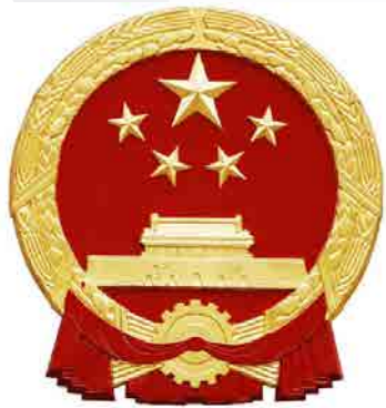
中华人民共和国国徽 (国徽, 国徽, 国徽, 国徽, 国徽, 国徽, 国徽, 国徽, 国徽, 国徽)

追古溯今，中央美术学院催生了中国最早的美术学制，开创了我国最早的书法、造型、设计、建筑、人文等大学学科，是现代以来中国美术高等教育的奠基者，也是国内所有美术生心中的“殿堂级校园”，被誉为“中国艺术家的摇篮”。