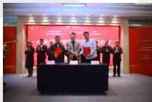
2023年2月16日 中央美术学院附属厦门中学 合作办学项目在海沧区签约落地

学校联合国内外一流艺术院校进行艺术综合能力拓展，注重培养具有纯正美育传承和国际素养的未来优秀艺术人才，助力更多艺考学子迈入国内外顶级艺术名校。