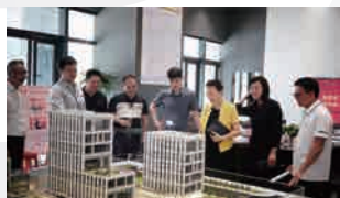
2023年5月18日 厦门市教育局副局长吴雪慧 莅临学校考察指导