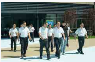
2023年7月6日 福建省人大副主任李德金 莅临学校考察指导